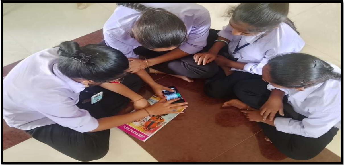
Music and Audio Settings