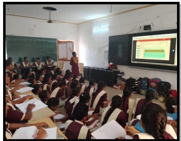
Training Social Media Strategy