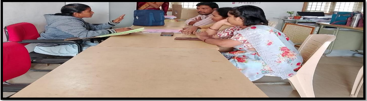
Committee members meeting