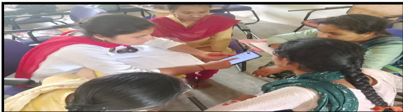
Students created the college events brochures